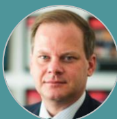
H.E. Mr. Kostas Karamanlis Minister of Infrastructure & Transport Hellenic Republic